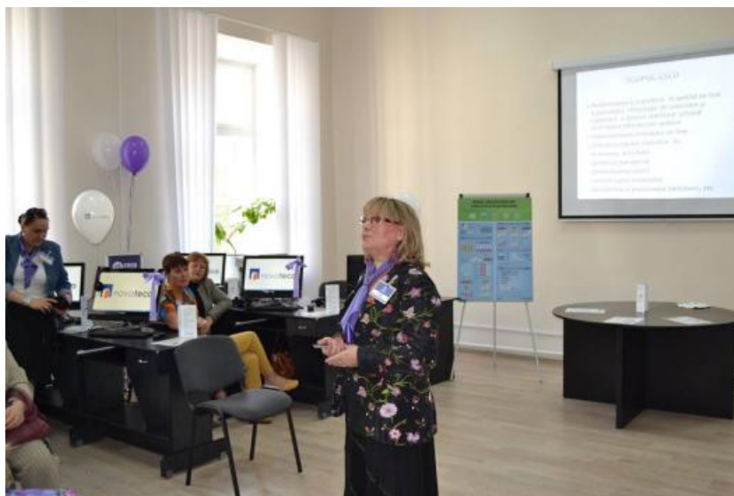
Centrul de Statistică, Cercetare și Dezvoltare

În 2015, în incinta Bibliotecii Naționale a fost deschis Centrul de Statistică, Cercetare și Dezvoltare. Centrul a fost creat în baza prevederilor Memorandumului de înțelegere, semnat între Ministerul Culturii al Republicii Moldova și Asociația Obștească Reprezentanța din Republica Moldova a Consiliului pentru Cercetări și Schimburi Internaționale „IREX”. În cadrul Centrului se organizează traininguri pentru bibliotecari din toată republica, inclusiv din BNRM. Centrul are sala de curs parțial amenajată.